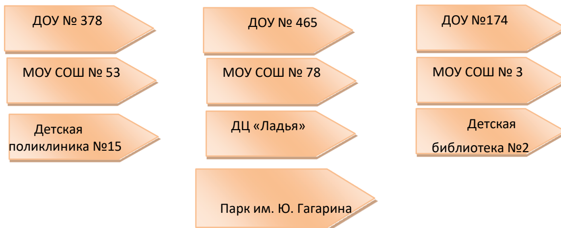
Схема ближайшего социокультурного окружения ДОУ № 186

В окружении ДОУ имеется достаточное количество учреждений образования, здравоохранения, спорта, условия которых используются педагогами ДОУ для решения разнообразных задач развития воспитанников.