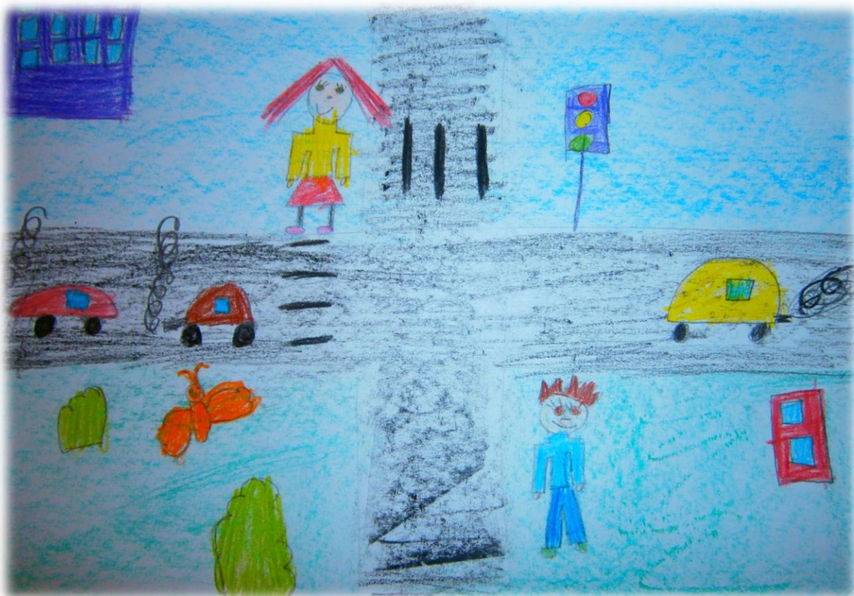
Рисунки Муратовой Даши

Но мы с тобой не зайцы, не волки, не кроты, все ходят на работу, и в садик ходишь ты. А мимо мчат машины, включив свои огни, и нам на перекрёстках нужны огни твои. Они нам помогают, нас учат с малых лет, шагать на свет зелёный, стоять на красный свет!!!